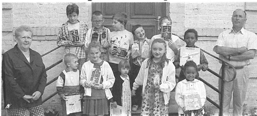
Les enfants scolarisés dans le regroupement ont reçu leur livre.