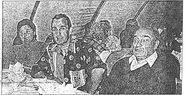
Une excellente soirée appréciée de tous les convives