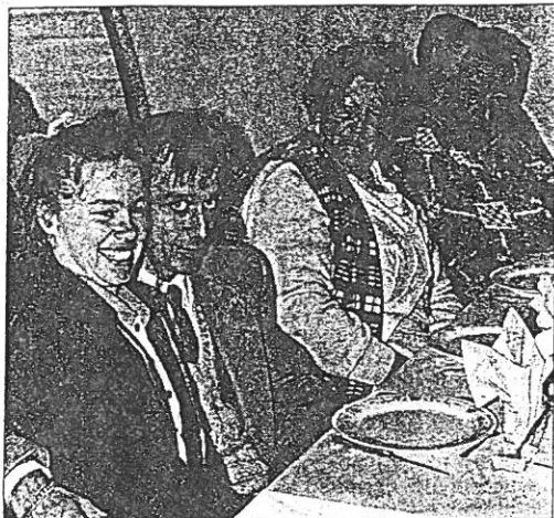
Un rendez-vous qu'il ne fallait pas manquer.