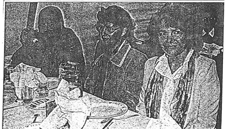
La ducasse, c'est une fois par an, tout le monde en profite et aime se retrouver autour d'une bonne table