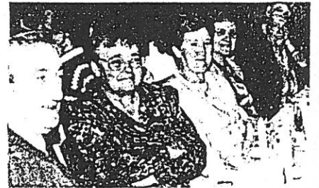
Près de 130 convives ont partagé ce repas de fête.