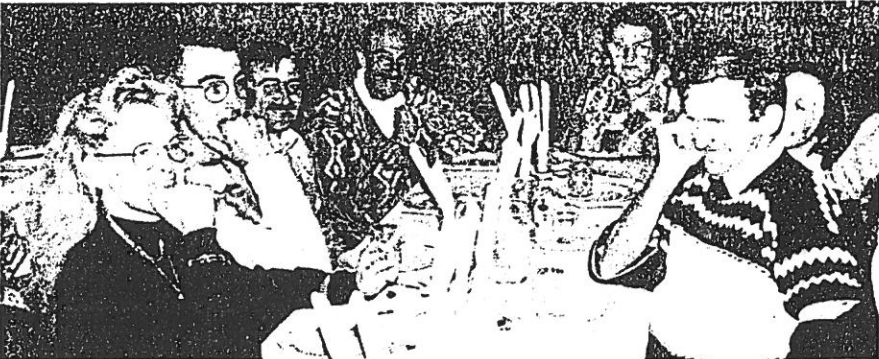
C'est au comité des fêtes et à la municipalité que l'on devait, samedi soir, ces sympathiques retrouvailles.