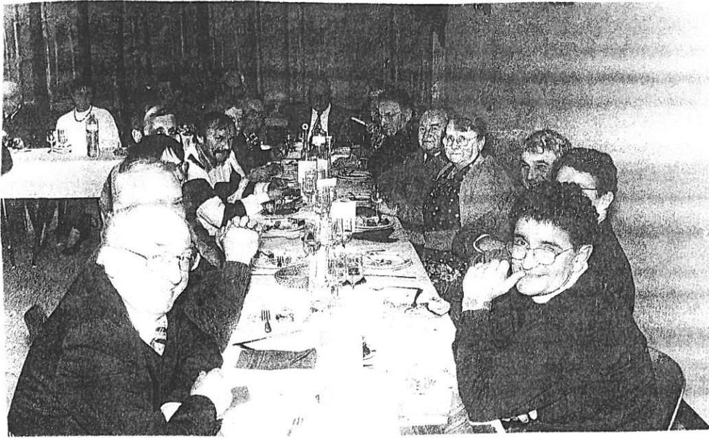
Banquet de la Société des Anciens Combattants 5 Mars 1995.