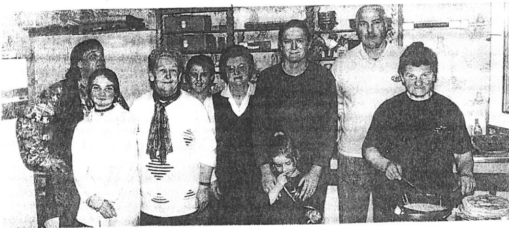
Soirée Crêpes du Comité des Fêtes 12 Mars 1995.