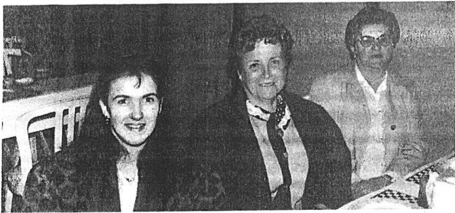
Ducasse 1994 (12 Octobre)