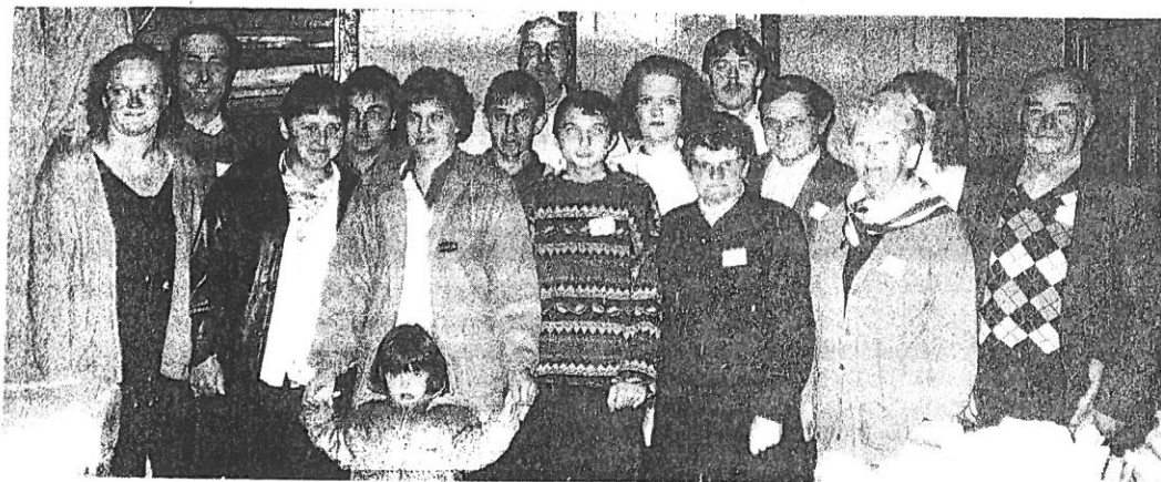
Le Comité d'organisation (12 Octobre 1994)