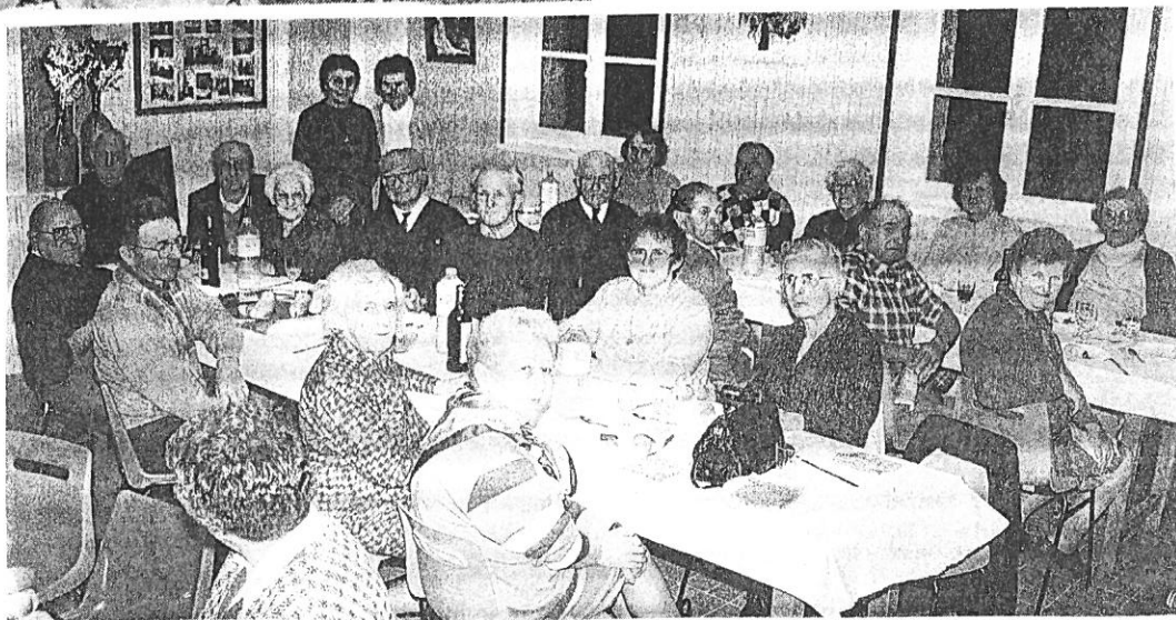
Goûter du Club "L'Amitié des Aînés" (17 Novembre 1994)