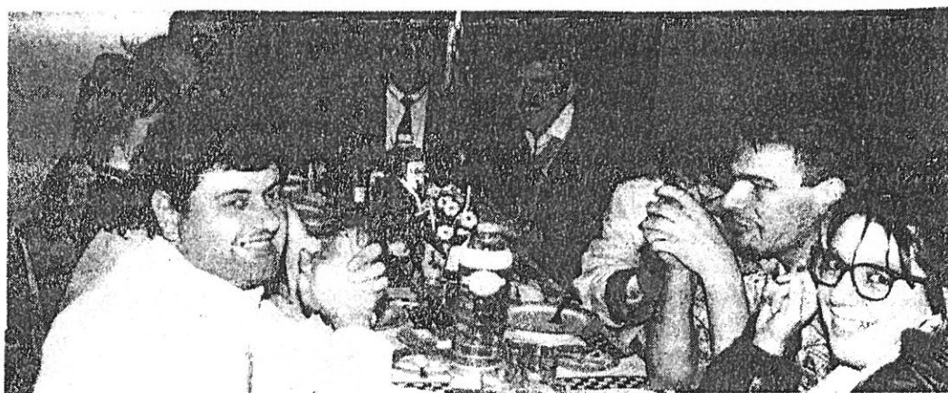
Des convives enthousiastes qui ont fait de cette soirée, un véritable succès.