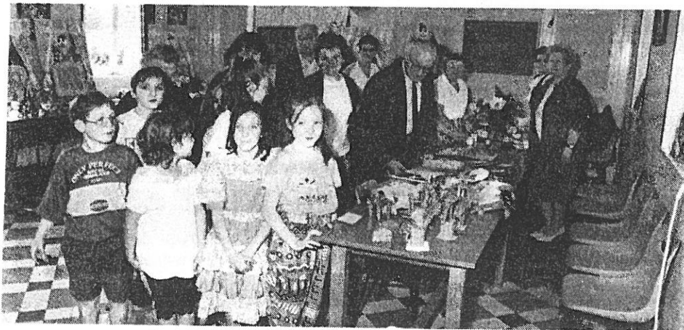
Une exposition appréciée