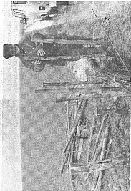
Reconstituer des barrages filtrants

Ces sortes de barrages filtrants, constitués de fagots de saule, redeviendront à terme de véritables haies et réduiront les obstacles canabales